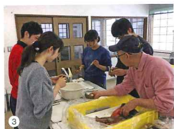
▲1階は体験教室などの地域交流の場として活用されている。