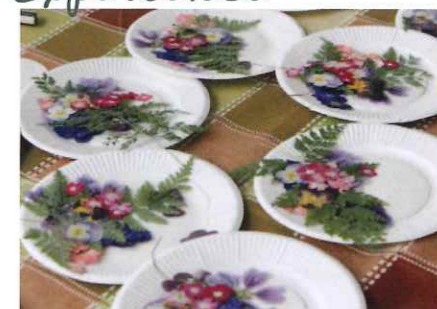
アート&クラフトなどさまざまなモノづくりが体験できる。