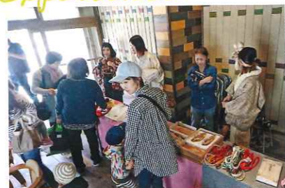
▲オープン時に1階で行われたイベントの様子。