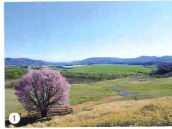
▲魚さばき体験など、浦河町には体験プログラムも充実している。