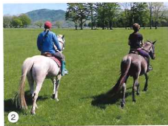
▲乗馬やホースセラピーが体験できるのも浦河町ならではの体験。