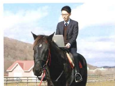
浦河町役場商工観光課 移住交流テレワーク誘致推進室 浦河郡浦河町築地1丁目3-1 TEL.0146-26-9013 https://urakawa-stay.net/