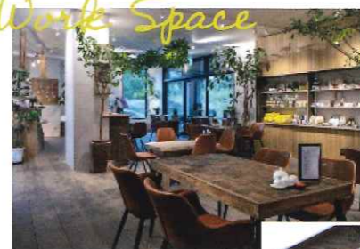
▲くつろぎながら仕事ができるオシャレなカフェ&レストランもある。 ▶ニセコエリアにはワーケーション専用スペースも増え始めている。