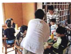
▲2階で開催された体験教室には、地元の人々が数多く参加する。

浦河郡浦河町大通4丁目8-2 TEL.0146-26-9820 (株式会社ユートライン) https://space-tatamiya.net/