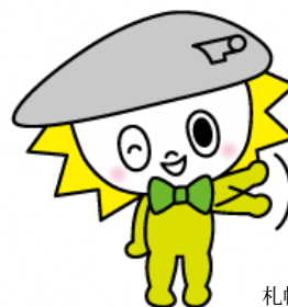
札幌ドーム マスコットキャラクター 「チャームコロン」