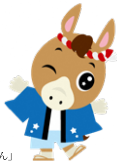
STV キャラクター「どさんこくん」

さまざまな形で、「わがマチ PR」にご活用いただけます！ お申し込みを心よりお待ちしております。